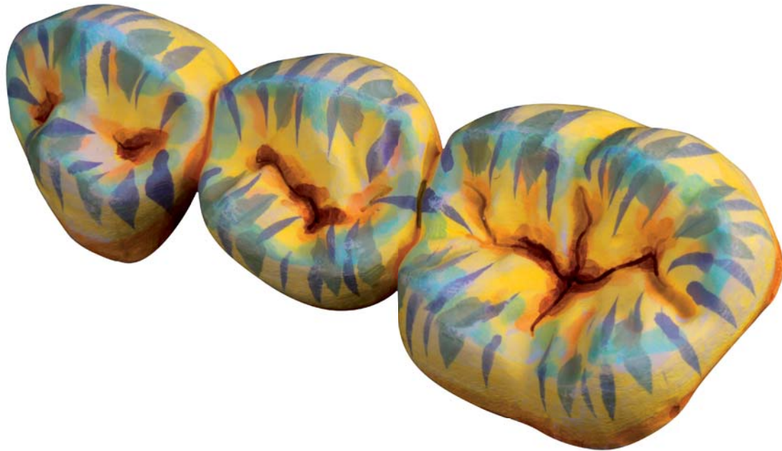
eingefärbte Arbeit vor dem Sintern

Die Colour Liquid Prettau® Aquarell Farben entsprechen grundsätzlich dem 16-V-Farbspektrum und sind säurefrei auf Wasserbasis hergestellt. Die neuen Colour Liquid Prettau® Aquarell Farben wurden zusätzlich mit speziellen ausbrennbaren Bio-Pigmenten als Orientierungshilfe versehen, damit jeder einzelne Pinselstrich vor dem Dichtsintern sichtbar und nachvollziehbar ist. Insbesondere die individuelle Farbgestaltung der Details wie z. B. der Mamelons sowie der Zervikal- oder Interdentalbereiche kann nun höchst akzentuiert und präzise