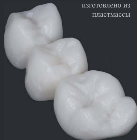
изготовлено из пластмассы