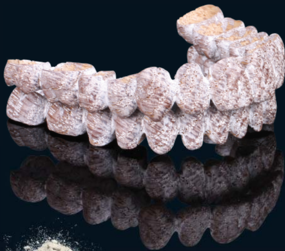
Quercia, imbiancata a calce

Per quanto concerne l'effetto estetico, il ponte può essere anche imbiancato a calce o impregnato con cera d'api. Su richiesta speciale può essere anche lavorato in quercia affumicata.