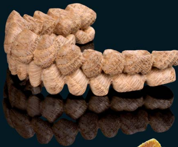
Chêne « cire d'abeille »