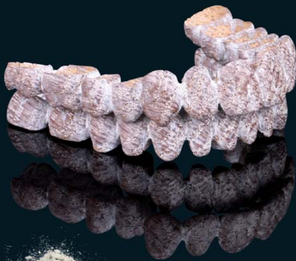
Chêne « chaulé »

L'esthétique souhaitée est obtenue en chaulant le bridge, ou en l'imprégnant de cire d'abeille. Autre possibilité : réaliser le bridge en chêne fumé.