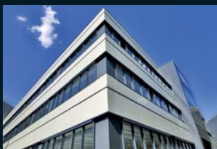
Zirkonzahn World Wide