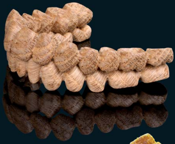
Eiche, mit Bienenwachs