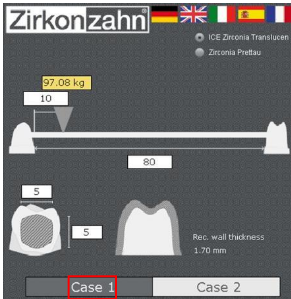
Пример 1. Имитационное моделирование свободного пространства между двумя штампами.