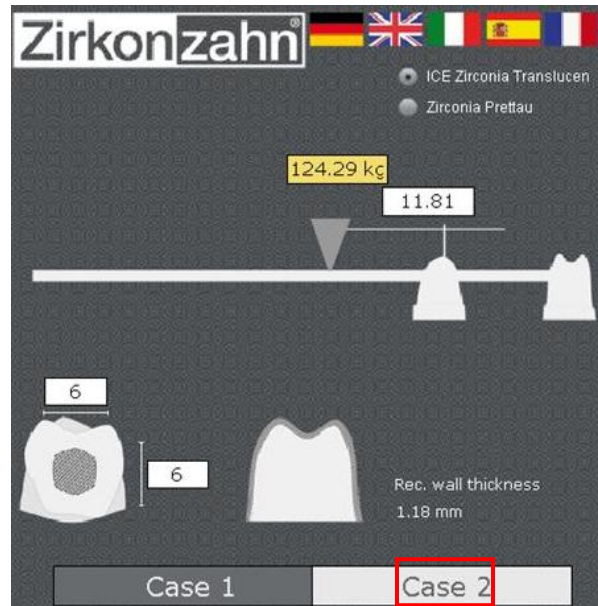
Пример 2. Имитационное моделирование одного или нескольких штампов, расположенных по соседству, за которыми следует один консольный элемент мостовидного протеза.