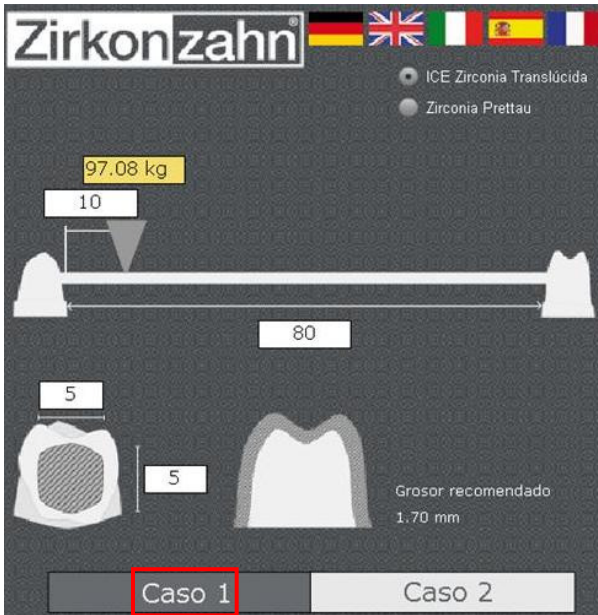
Caso 1 simula un espacio libre entre dos muñones.