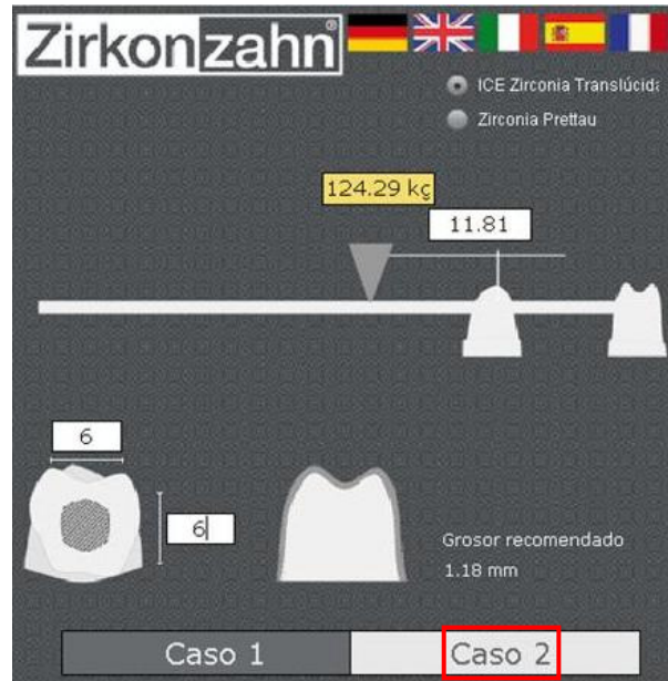
Caso 2 simula dos o más muñones, uno al lado de otro, seguido por un puente cantilever.